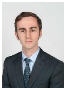
Edouard NIEPCE Gestion commerces et bureaux